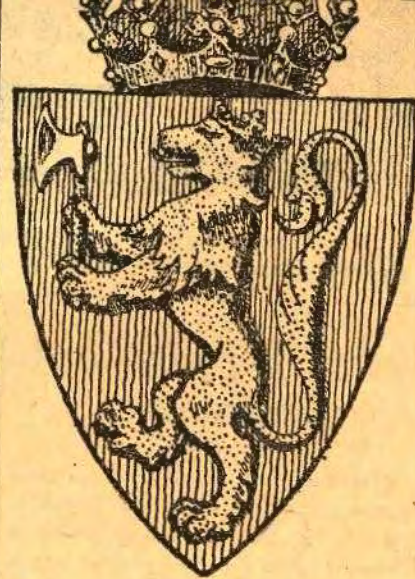
Norges våben idag.

på sin side riktigheten av denne offisielle danske fremstilling av dette historiske forhold og dets juridiske karakter.