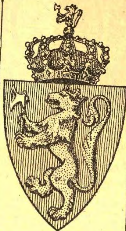
Norges våben idag.

på sin side riktigheten av denne offisielle danske fremstilling av dette historiske forhold og dets juridiske karakter.