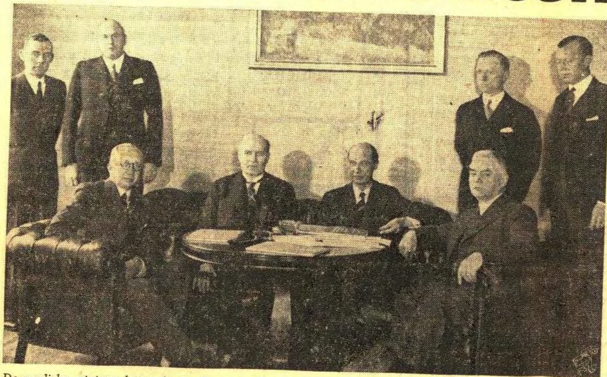
De nordiske ministre fotografert ved møtets begynnelse i formiddag. Rundt bordet sees sittende fra venstre: Holsti, Finland, Munch, Danmark, Sandler, Sverige, og Koht, Norge.

Sandler: Sverige vil ikke melde sig ut av Folkeforbundet, men landet må være løst fra sanksjonsforpliktelse.