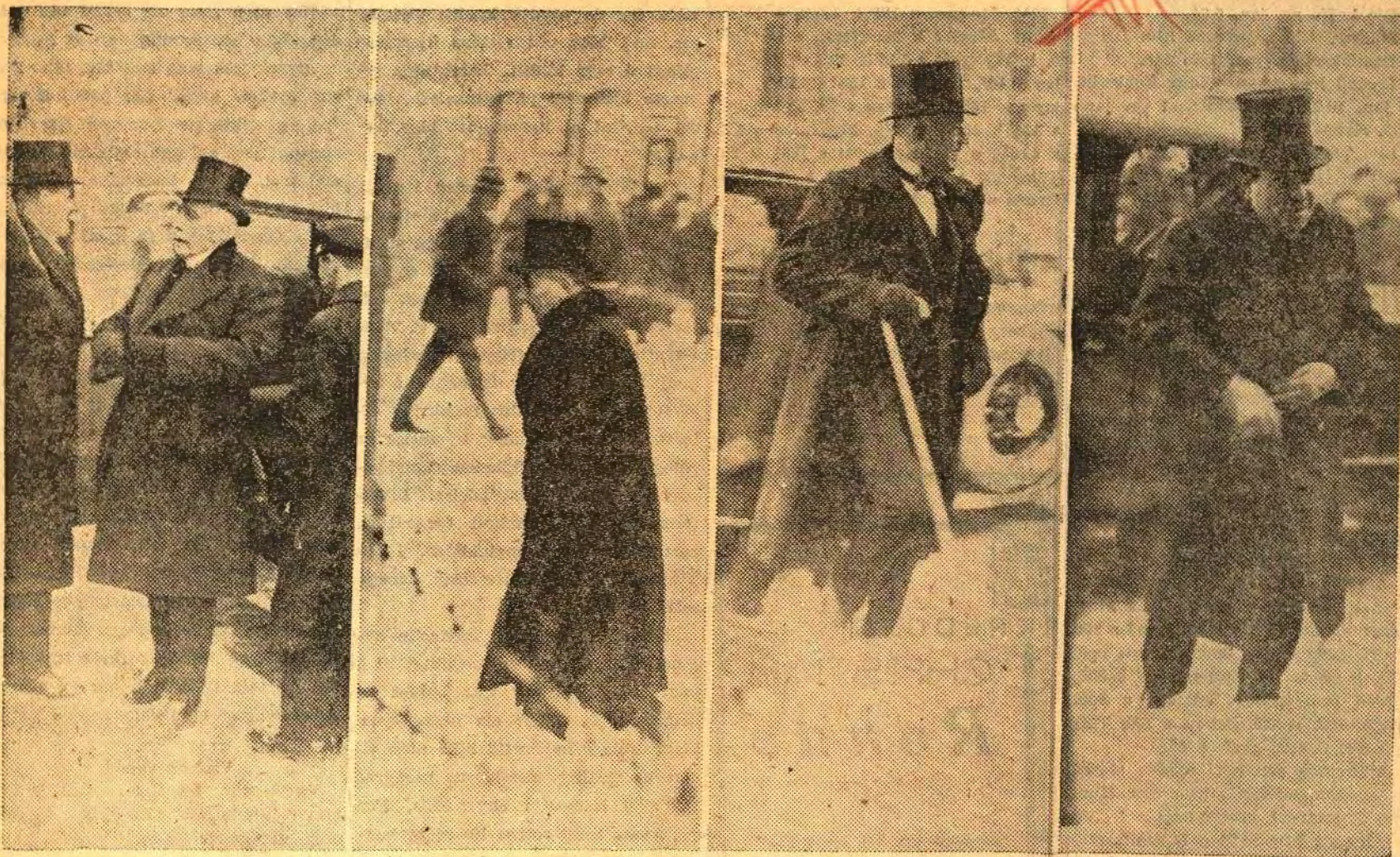
Far venstre: Hoffmarskalk Wedel Jarlsberg, hoffsjef Knagenhjelm, den franske minister, den amerikanske minister, stortingspresident Hambro.

'Oslo Aftenavis' nr 8. Lørdag 10 jan. 1931.