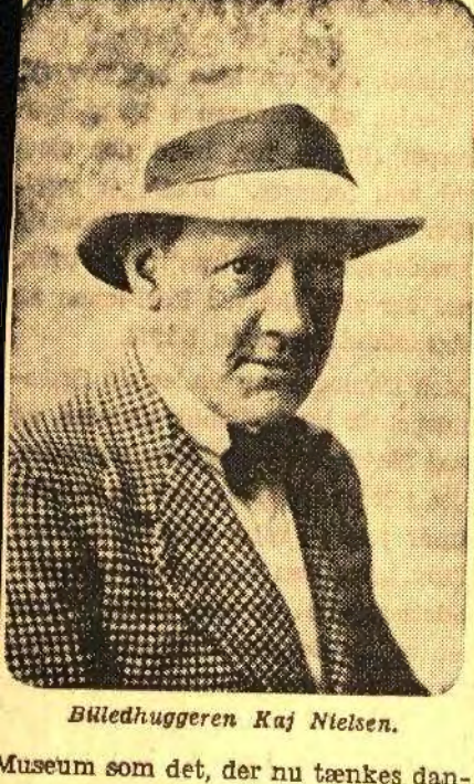
Billedhuggeren Kaj Nielsen.

Den tredje er godt opstillet i Anlægget; Busterne er samlede i Forhallen og Vanskelighederne ved Belysningen, saa godt det lader sig gøre, afbødende ved Opstilling af Skærme. Der er da heller ikke fra nogen Billedhugger givet Museet Forslag til en bedre Ordning under de engang givne Forhold. Den væsentligste Grund til Skepsis overfor Planen om et Kaj Nielsen-