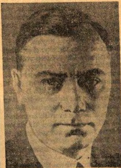
Alfred Rosenberg, der deltager i Stævnet

Foredrag „Dansk Ungdoms Stilling mod Nord og Syd“ og indledede med en Skildring af den rolige historiske, økonomiske og sociale Udvikling, der gennem Aarhundreder havde fundet Sted i Danmark, hvis geo-politiske Beliggenhed i national Henseende var nordisk med kontinental Position.