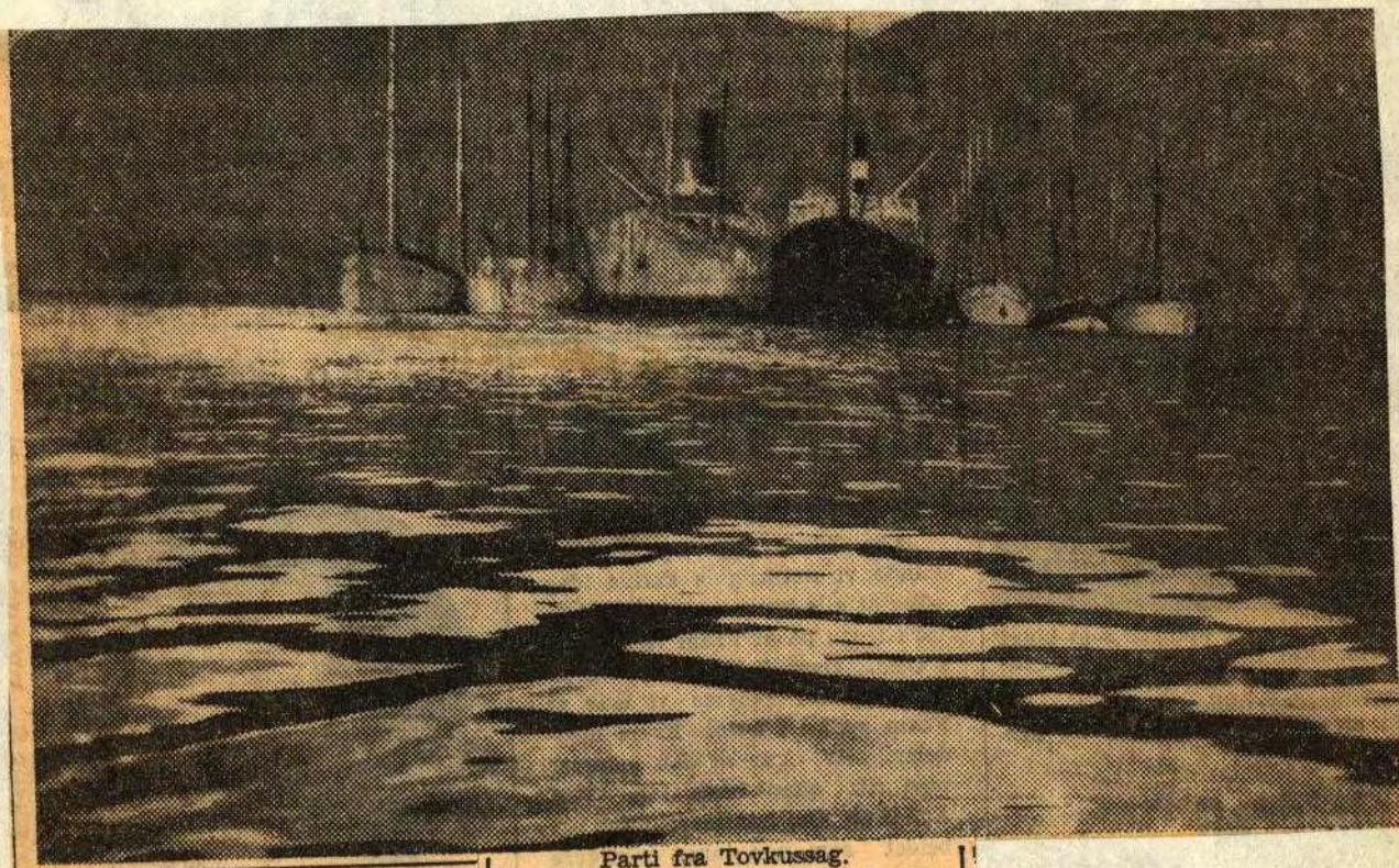
Parti fra Tovkussag.