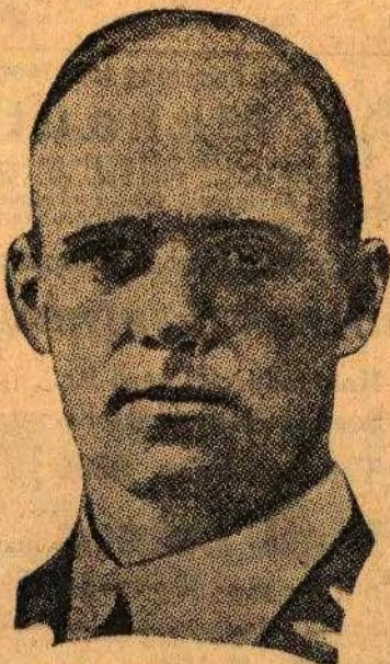
Justitsminister Arne Sunde.

Justitsminister Sunde har derefter udsendt en Erklæring, hvori han for første Gang indrømmer, at han i Høsten 1932 blev underrettet om, at Statsmini-