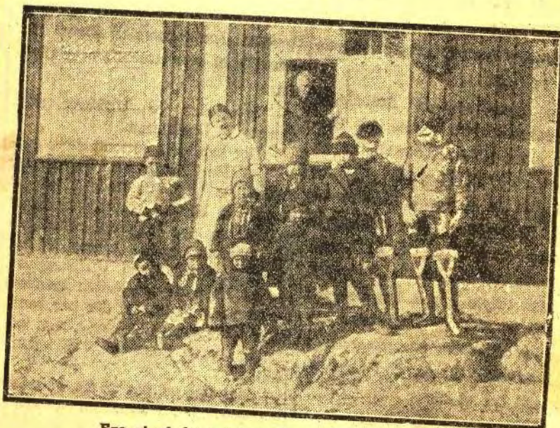
Fra et af de grønlandske Børnesanatorier.

Om det Arbejde, der udføres paa de grønlandske Børnesanatorier, giver følgende lille Uddrag af en Dagbog, ført af Forstanderinden paa Sanatoriet »Sukkertoppen« et godt Billede: