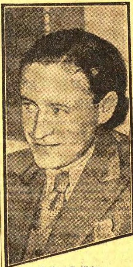
M. Paul E. Victor.

M. Victor oplyser endelig, at Franskmændene i Sommer agter at foretage en interessant Bjergbestigning i Østgrønland. Dr. Lauge Koch opdagede i Fjor under en Flyvning en Bjergkæde med 4—5000 Meter høje Bjerge, og dem vil man i Sommer undersøge nærmere.