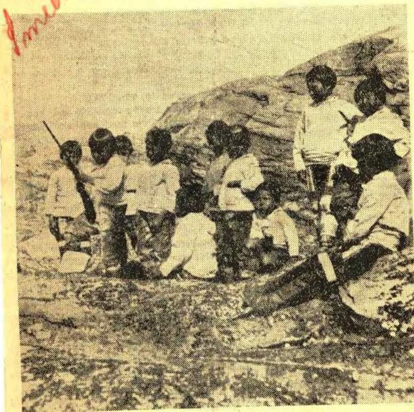
Legende Børn ved Sanatoriet i Umanak.

Der kaldes paa Hjælp fra mange Sider, og Tiderne gør det svært for dem, der har paataget sig at formidle gode Menneskers Kærlighedsgerninger overfor de Fattige eller uheldigt stillede. Derfor er det — bl. a. — gaaet tilbage med Støtten til det danske Hjælpearbejde overfor de smaa, svagelige Grønlanderbørn. Det kan,