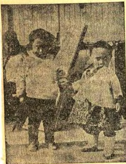
Et Par af de mindste Patienter paa Børnesanatoriet „Umanak“.