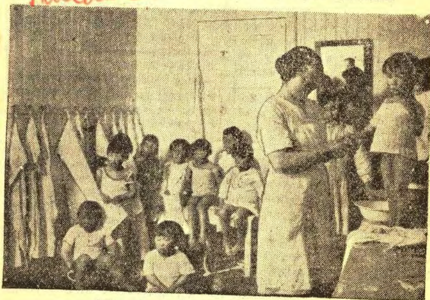
Aftenvask paa Børnesanatoriet „Sukkertoppen“.

Indsaml Et Lotteri til Fordel for Børneforsorgen paa Grønland.