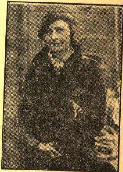
Mrs. Rockwell Kent, der har besøgt sin Mand, den amerikanske Maler, i Holsteinsborg.

Fortøjninger af svært Jern. Hvis „Sælen“ er gaaet ned, er det ganske sikkert sket i denne frygtelige Nat, kun et Par Dage efter, at Skibet har forladt Upernivik.