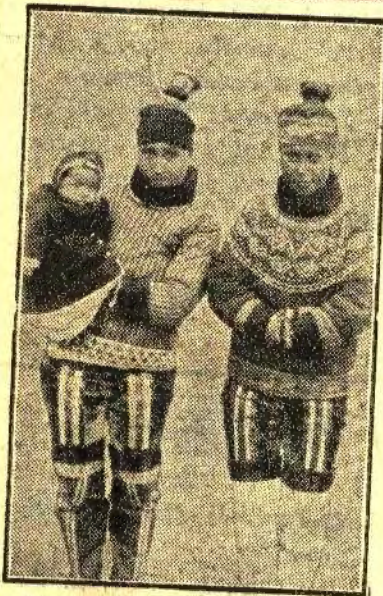
En Grønlandermoder med sit Barn.

Vi har tidligere omtalt det store og gode Arbejde, Foreningen til Hjælp for grønlandske Børn udretter bl. a. for at bremse Tuberkulosen blandt