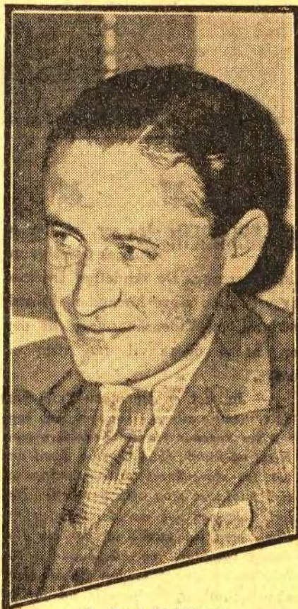
M. Paul E. Victor.

Røntgenfotograferingen vil vi fore- tage for at undersøge en Slags tuber- kuløs Sygdom, som Eskimoerne angri- bes af. Den ytrer sig ikke som almin- delig Tuberkulose, saa at de er egent- lig syge, end sige uarbejdsdygtige.