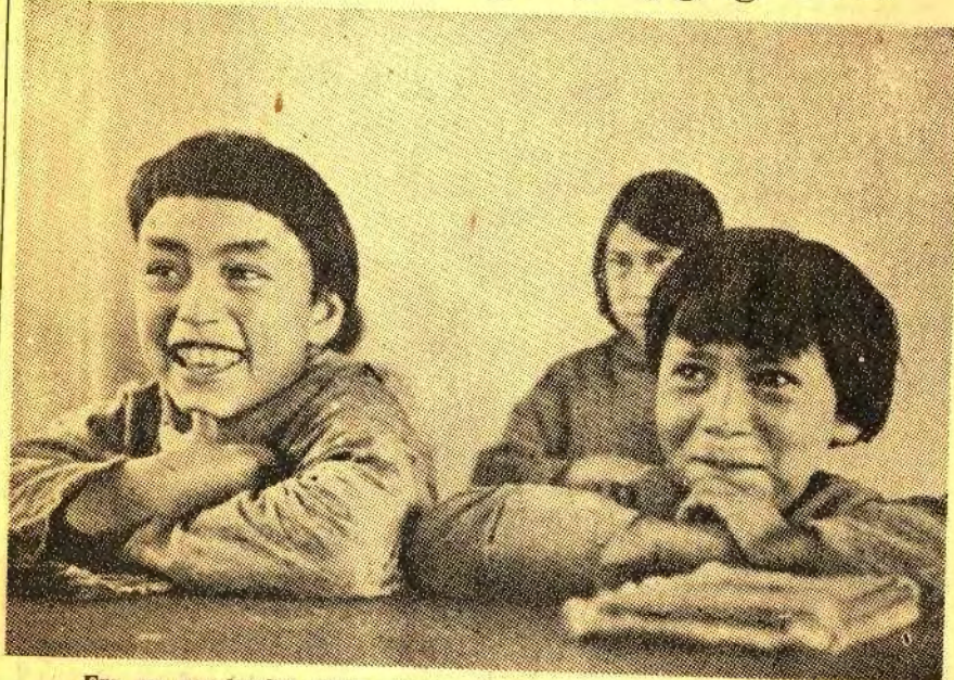
Fra en grønlandsk Skole.

D E ulykkelige Forhold Verden over har nu ogsaa ført Grønland ind under nye Forhold, og enhver Dansk er optaget af, hvilken Skæbne den eskimoiske Befolkning vil faa, og hvor- ledes det, der sker, vil virke paa den.