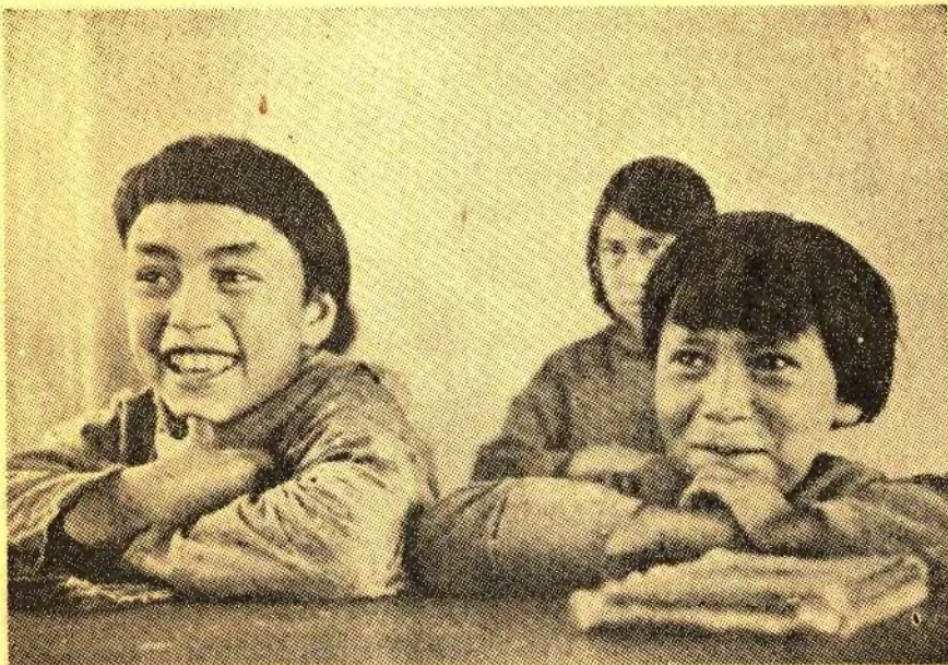
Fra en grønlandsk Skole. Fotografi fra Jette Bangs Grønlandsbog.

D E ulykkelige Forhold Verden over har nu ogsaa ført Grønland ind under nye Forhold, og enhver Dansk er optaget af, hvilken Skæbne den eskimoiske Befolkning vil faa, og hvorledes det, der sker, vil virke paa den.