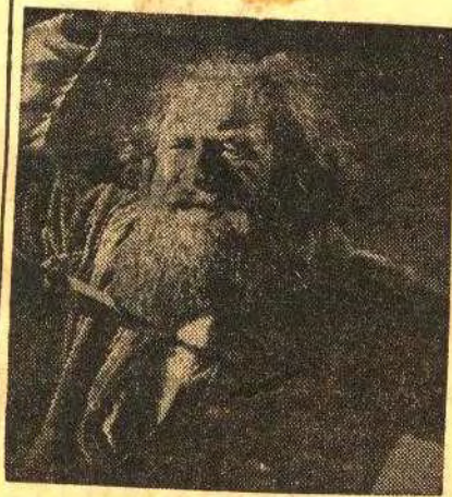
Peter Freuchen i „Eskimo“.

Kvinner som blir „lånt bort mot brennevin“.