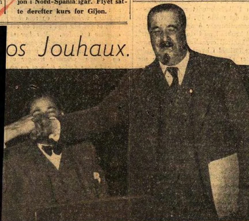
erte Caballero lenge med generalsekretæren i den franske landsorganisasjon hilse hjertelig på hverandre, Jouhaux til høyre og Caballero til venstre.