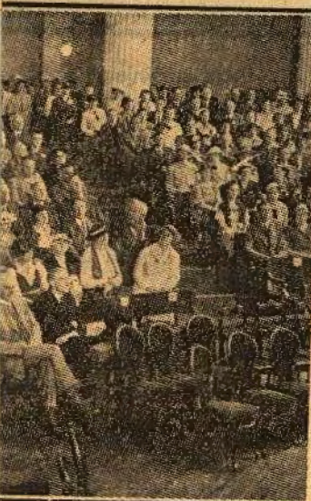
et 4. nordiske biblioteksmøte disse dager.

som man i samme gjor godtroende og arbeider nene. Det Den øk både Musse har vært b iske interes «sosialisme I tillegg til istklassen k delige unde kåprustning velse av al freden i far