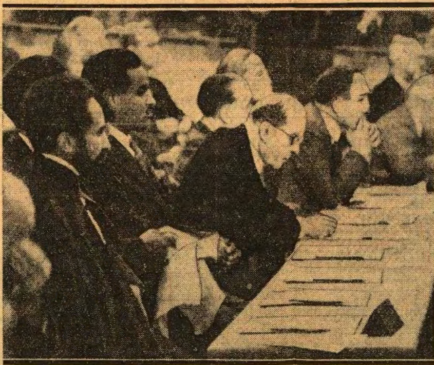
Siste billede fra delegertforsamlingens møte i Genève. Haile Selassie sees her på samme benk som den franske delegasjon. Man ser keiseren i forgrunnen, i bakgrunnen skimtes Blum og Delbos.

Omtalen av art. 19 (revisjonsparagrafen) vakte meget stor interesse.