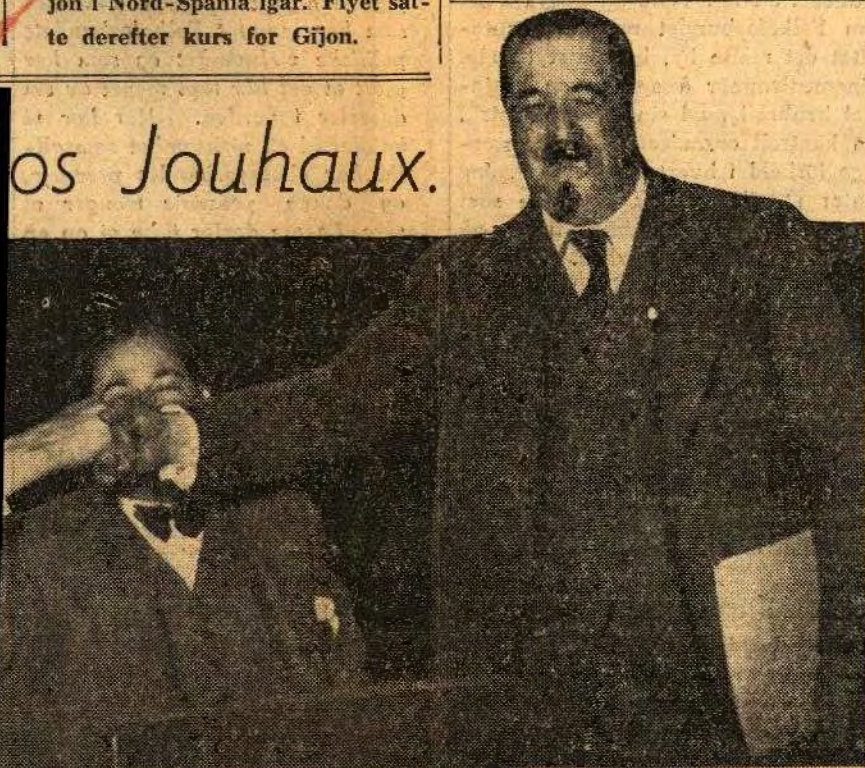
erte Caballero lenge med generalsekretæren i den franske landsorganisa-