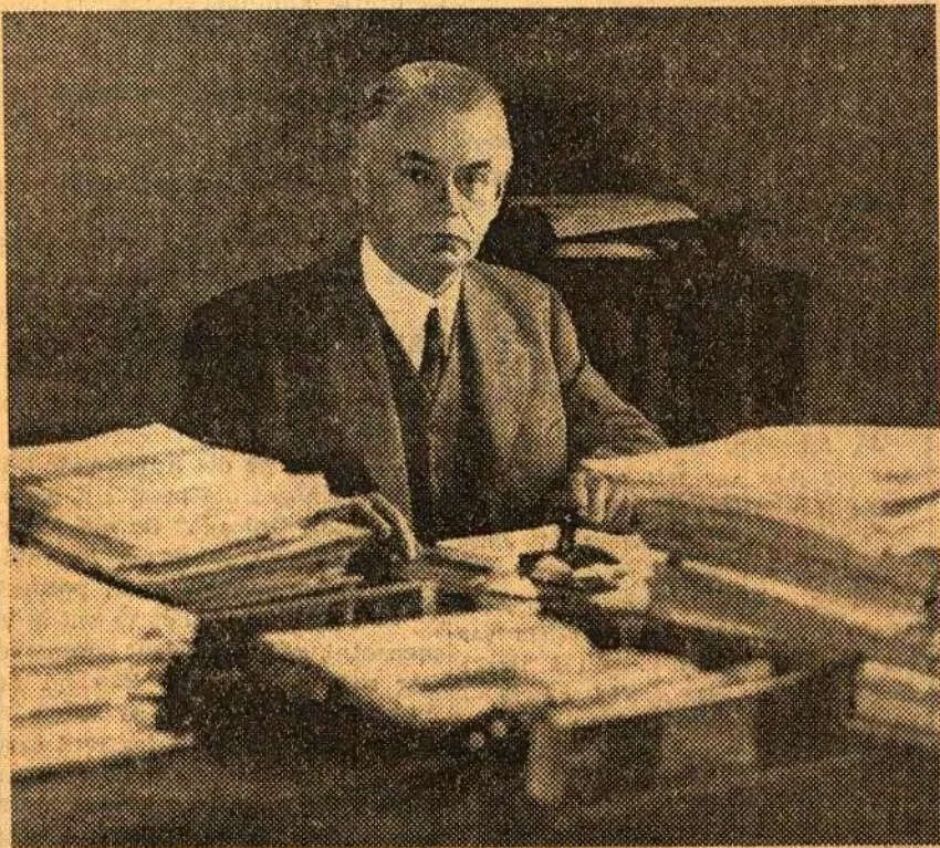
Utenriksminister Halvdan Koht.

Men Hannevigsaken i så god gjenge, at det er unødvendig å drøfte den