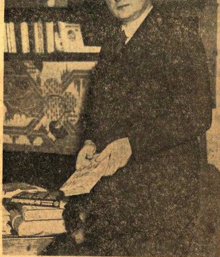
Professor Jac. Worm-Müller.

Første juledag er professor, dr. Jac. S. Worm-Müller 50 år. På selve dobbelthelligdagen, da selv de høioffentligste menn er krøpet inn i privatlivets Diogenes-tønne med familie og ribbe, og verdens bekymringer for en gangs skyld undlater å velte sig inn i stuen til en med den ferske morgenavis eller høit-taleren. Men professor Worm-Müller må minst reise til Horten imorgen, byen som næsten valgte ham til stortingsmann, hvis han vil slippe ovasjoner. Det kongelige Frederiks morsomste professor, den elegante forms mester — jeg husker ennu med beundring hans prøvet forelesning for dosentstillingen. Det var om Gambetta. I knappullet satt en stor hvit blomst og formelig slikket sol i all denne næsten romerske veltalenhet som gjorde auditorium 6 til et verdenspolitisk forum de tre kvarter forelesningen varte. Senere har Worm-Müller skrevet og talt og kåsert og gjort verden morsom for sine medmennsker, noget av det nyttigste man kan gjøre, han har lunsjet med Lloyd George og holdt valgforedrag i Horten, han har gitt sine studenterkull et befruktende historisk vid-syn som sikkert også kommer deres elever igjen til gode, han har skrevet sitt verdige monumentalverk om sjøfartens historie, kanskje det mest plastiske historieverk som er skrevet på norsk. Og han er blitt en av våre interessanteste politiske profiler, til tross for at hans politiske karriere ennu ikke er begynt. Til gjengjeld er det så mange av dem med karriere som ingen profil har.